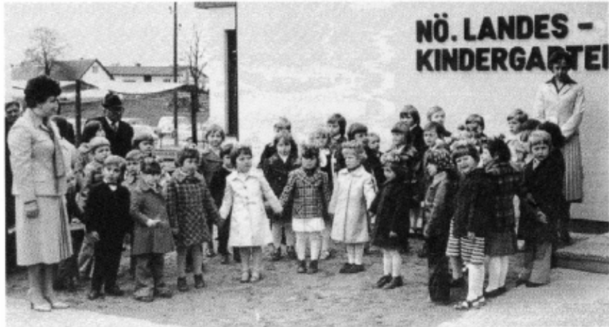
Kindergarten- eröffnung 1978