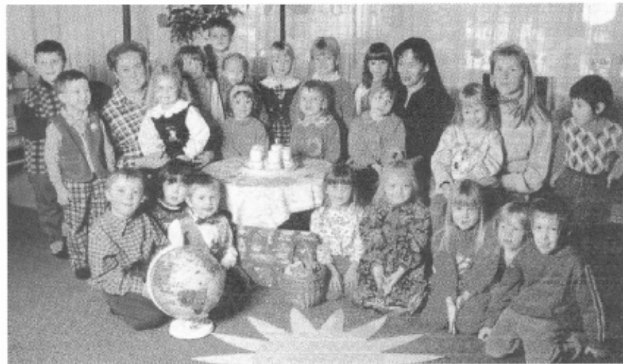
Kindergarten- kinder 1999