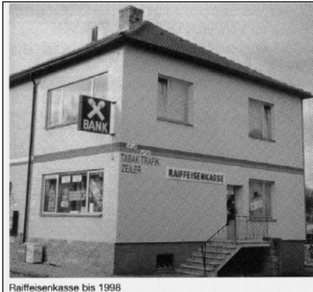
Raiffeisenkasse bis 1998