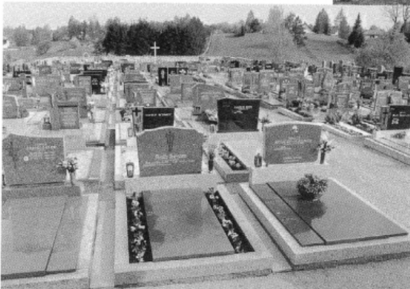
Unser Friedhof 1999